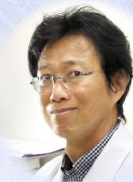
新大塚榎本クリニック院長 精神保健指定医